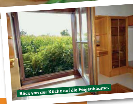
Blick von der Küche auf die Feigenbäume.

Die Inneneinrichtung überzeugt durch hochwertige Materialien und Liebe zum Detail.